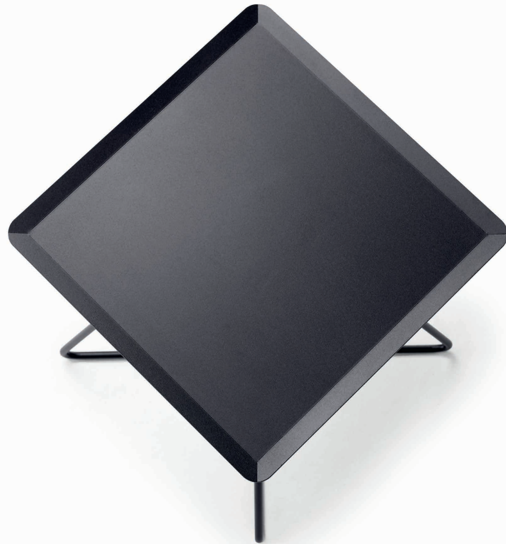
STEELY SQUARE in Feinstruktur schwarz lackiert STEELY SQUARE in Fine structure black lacquer

The established STEELY is now also available as a square. The characteristic feature of this four-legged steel table is its slightly upwards-trimmed edge.