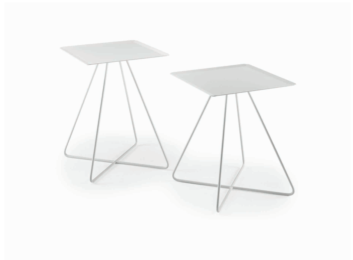
STEELY SQUARE in Feinstruktur weiss lackiert STEELY SQUARE in Fine structure white lacquer