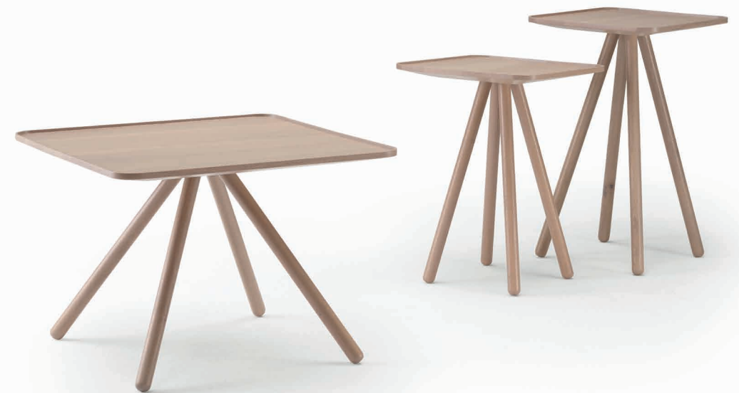
SOFT SQUARE in Eiche elefant gebeizt SOFT SQUARE in Elefant stained oak